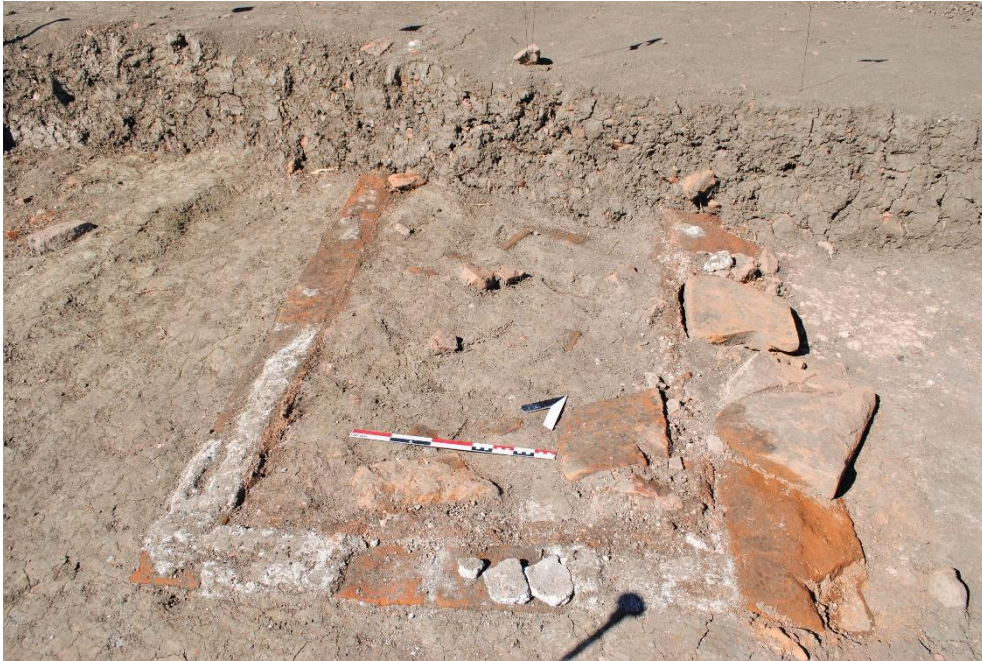
Fig. 2. La vasca in corso di scavo; si noti lo spessore dell'interro.