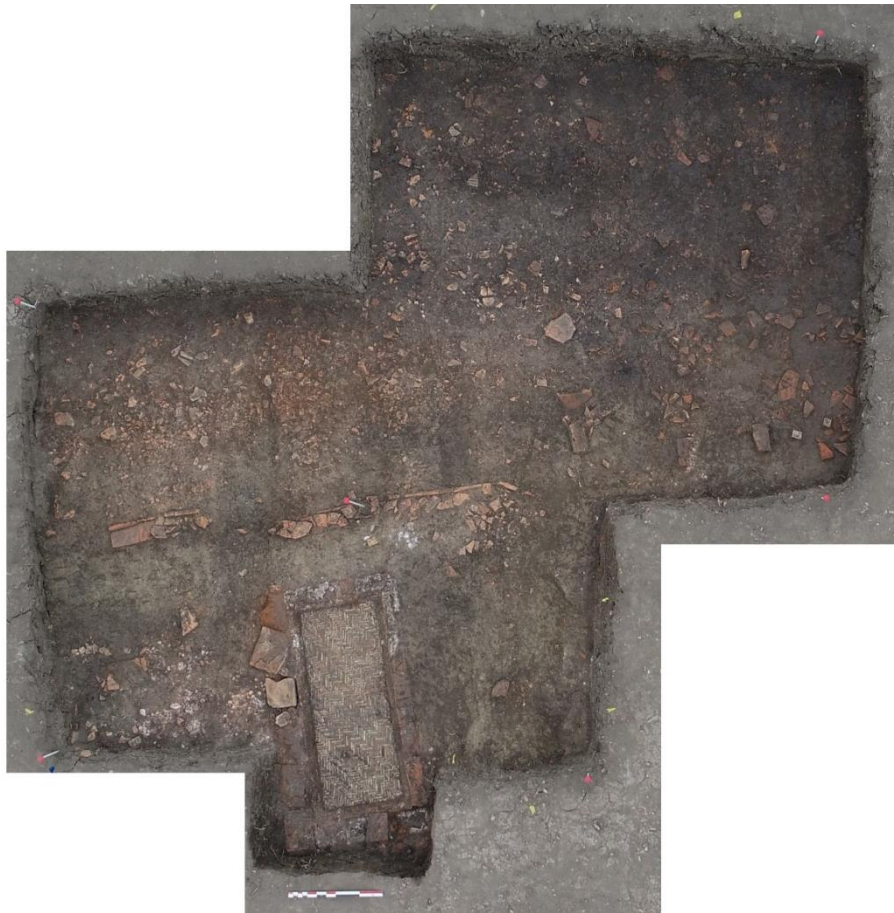
Fig. 1. Il saggio 2.

Chiara Guarnieri chiara.guarnieri@beniculturali.it