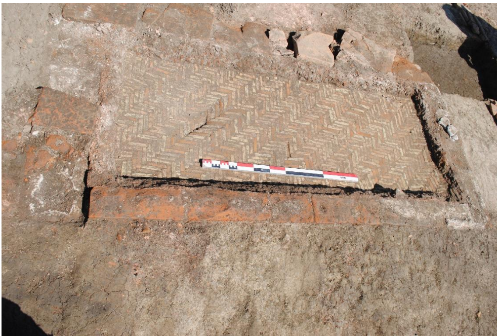
Fig.3. La vasca in laterizi.