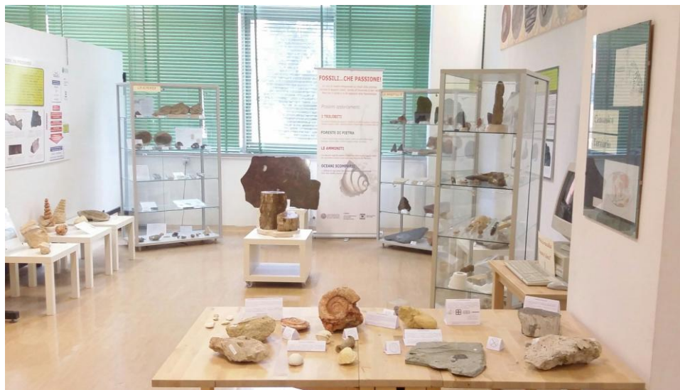
Figura 1. Una sezione del Laboratorio fossili, annesso alla Collezione “Coletti”. Museo di Scienze della Terra dell'Università degli Studi di Bari Aldo Moro.

Accanto alle proposte della “neuroeducation” sono emerse anche sollecitazioni a riflettere sui mutamenti indotti dai nuovi media nell'apprendimento e nelle relazioni sociali (Fig.1). La cybercultura , che si è materializzata a partire dagli ultimi anni del XX secolo con l'introduzione dei dispositivi integrati di connessione e condivisione 4 , ha posto il problema di un adattamento dei paradigmi educativi. Il cambiamento epocale è stato il passaggio da una gestione individuale dei materiali (di lavoro, di studio o di svago), condizionata dall'accesso agli strumenti, alla connettività via web e alla soluzione delle esigenze della quotidianità con apparecchi portabili, perennemente connessi e in grado di generare e diffondere i contenuti senza dipendere da altri dispositivi. Oggi strumenti e contenuti sono tutti sul cloud . Il Web 2.0 ha cambiato la struttura stessa della produzione della cultura e della comunicazione, perché ha abbattuto i limiti tra il virtuale ed il reale ed ha generato una nuova dimensione di realtà amplificata, in cui tutto è dinamico, multimodale e condiviso. Da un lato le possibilità d'apprendere sono cresciute, dall'altro si è creata una modalità di relazione, che ormai è integrata nella realtà di ognuno, in tutte le sue manifestazioni. Le giovani generazioni sono più attratte dalle nuove forme di comunicazione e negli spazi aperti dal digitale hanno creato i luoghi di una condivisione sociale, impostata secondo le regole della rete 5 .