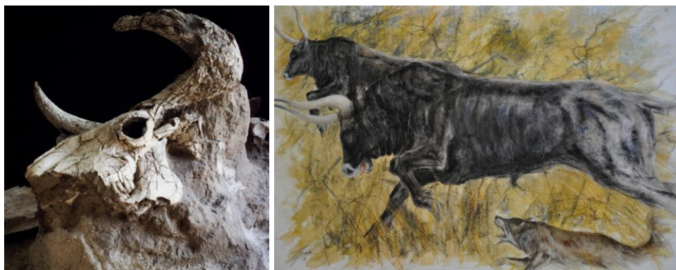
Figure 4 – 5. Bos Primigenius Bojanus e, accanto, “Uri in fuga” di Tommaso Genchi, in una rappresentazione possibile dei grandi bovidi del passato (acquerelli e pastelli su legno). Museo di Scienze della Terra dell'Università degli Studi di Bari Aldo Moro.

Un museo universitario, almeno per le collezioni più recenti, avrebbe un'indubbia facilità a collegare storie significative di esperienze professionali agli oggetti posseduti, soprattutto se le collezioni sono il precipitato delle attività di studio ed insegnamento compiute nel medesimo contesto (Figg. 4-5). Alcune interviste ai docenti o agli allievi componenti di un determinato gruppo di ricerca, realizzate come racconto disegnato di vicende personali, potrebbero essere linkate nel sito del museo agli oggetti presentati oppure potrebbero essere fruibili al pubblico in presenza. C'è anche un altro aspetto che rende interessante questa metodologia comunicativa: la raccolta delle interviste diviene una risorsa culturale del museo, come frammento di memoria orale, che assume valore di testimonianza per la storia dell'istituzione o dello sviluppo di una disciplina. Pertanto, attraverso video draw my life , fatti realizzare agli scienziati con la collaborazione di esperti di comunicazione, si creano learning object (LO) e nello stesso tempo si recuperano contenuti di memoria di grande interesse, che entrano nel patrimonio proprio del museo.